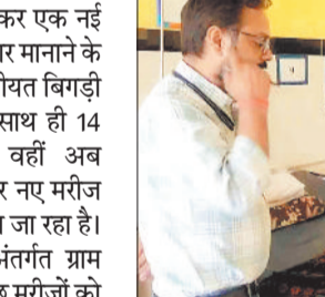
मरीज का उपचार करते चिकित्सक।