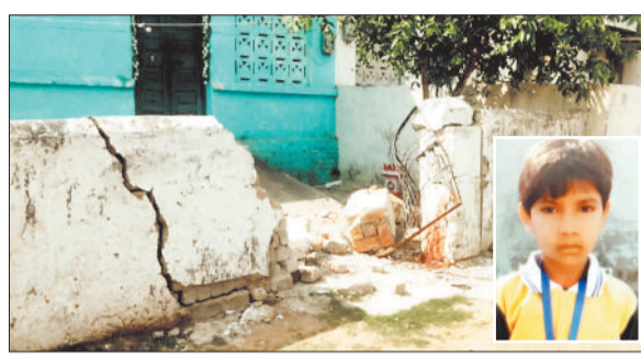
घटनास्थल जहां दुर्घटना हुई। इनसेट में मृत बालिका।