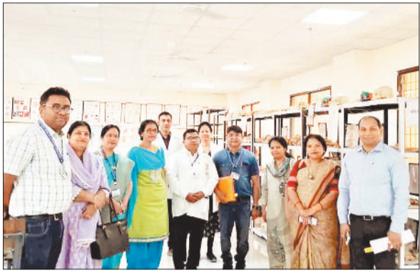
निरीक्षण टीम व अस्पताल के अधिकारी।

कुमाती देवेन्द्र कुमारी सिंहदेव शासकीय चिकित्सा महाविद्यालय में एमबीबीएस के साथ ही पीजी की पढ़ाई हेतु मान्यता मिली थी। मेडिकल कॉलेज को पूर्व में कुल 15 विषयों माइक्रो बायोलॉजी, फार्मेकोलॉजी, नेत्र रोग, कम्युनिटी मेडिसिन, शिशु रोग विशेषज्ञ, बायो केमेस्ट्री, एनाटॉमी, फिजियोलॉजी, पैथोलॉजी, जनरल मेडिसिन, जनरल सर्जरी, अस्थि रोग, इंफेन्टी, प्रसूति एवं स्त्री रोग, निश्चिन्ता विषयों पर एमडी एमएस के लिए कुल 46