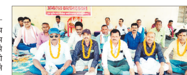
हड़ताल में बैठे पंचायत सचिव।

छग पंचायत सचिव संघ के प्रांतीय निकाय के आह्वान पर जिले के ग्राम पंचायत सचिव बीते 17 मार्च से अपनी एक सूत्रीय मांग मोदी की गारंटी लागू करने यानी शासकीयकरण करने को लेकर जिला मुख्यालय बैकुण्ठपुर के प्रेमाबाग मंदिर परिसर में अनिश्चितकालीन हड़ताल पर डटे हैं। पंचायत सचिवों का आंदोलन करते एक माह पूरा हो गया। गुरुवार को धरना प्रदर्शन को संबोधित करते हुए पदाधिकारियों ने कहा कि सरकार ग्राम पंचायत सचिवों के जायग मांग पर अब तक विचार नहीं कर रही है। पदाधिकारियों ने कहा कि सरकार नहीं बना था, तब भाजपा घोषणा में मोदी