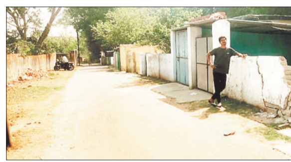
इस रास्ते पर सिखा रहा था ड्राइविंग।