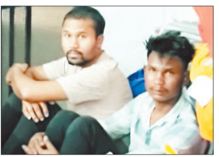
पुलिस हिरासत में लिए गए चालक।